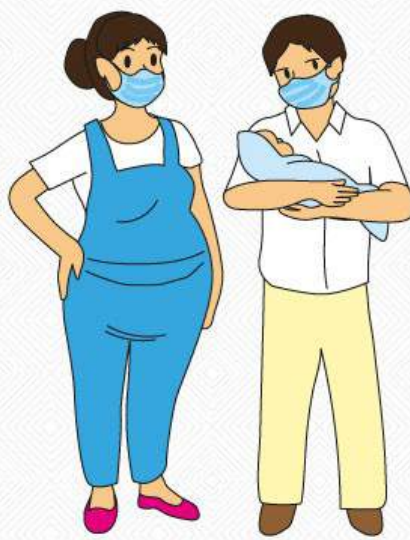
Embarazadas o personas con niños menores de 1 año