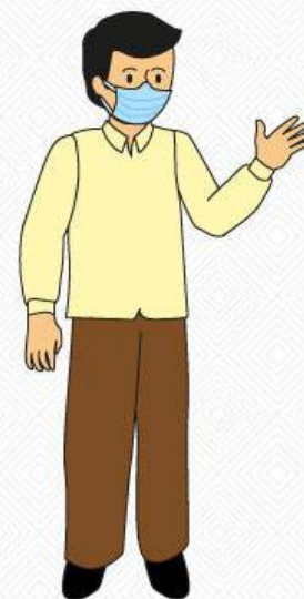
Candidatos o candidatas

Se procederá al voto asistido para las personas que tengan dificultades de movilización, no videntes o con problemas auditivos o algún otro impedimento para emitir su voto de forma personal y necesiten asistencia, pueden hacerlo acompañados de una segunda persona familiar o acompañante