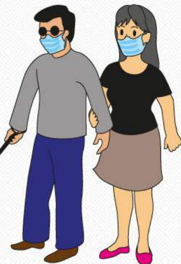
Personas enfermas o con discapacidad