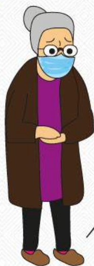
Ancianos o mayores de 60 años

El día de la jornada electoral se dará preferencia a las siguientes personas: